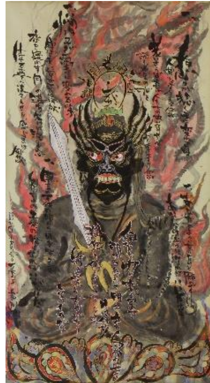
長淵剛「不動明王～怒りが悲しみに変わる時～」1998年