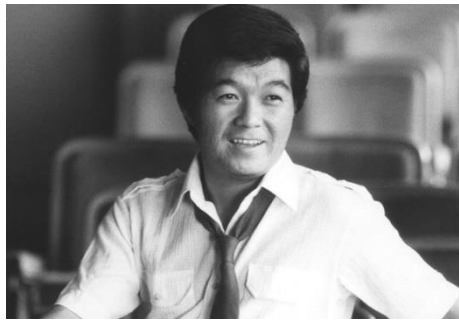
坂本九氏写真