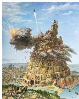
原太一「Once upon a time」2022年