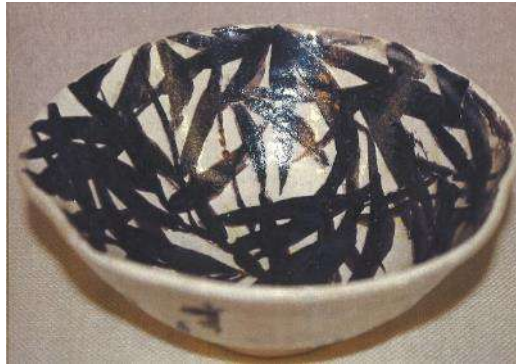
竹久夢二《鉄絵笹茶碗》1922年 山田市蔵コレクション