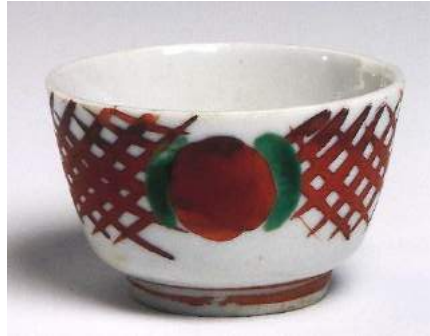
北大路魯山人《赤呉須さけのみ》 笠間日動美術館所蔵