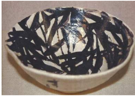
竹久夢二《鉄絵笹茶碗》1922年 山田市蔵コレクション 笠間日動美術館所蔵