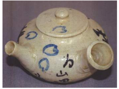
竹久夢二《蜂抱落花飛茶瓶》 山田市蔵コレクション 笠間日動美術館所蔵