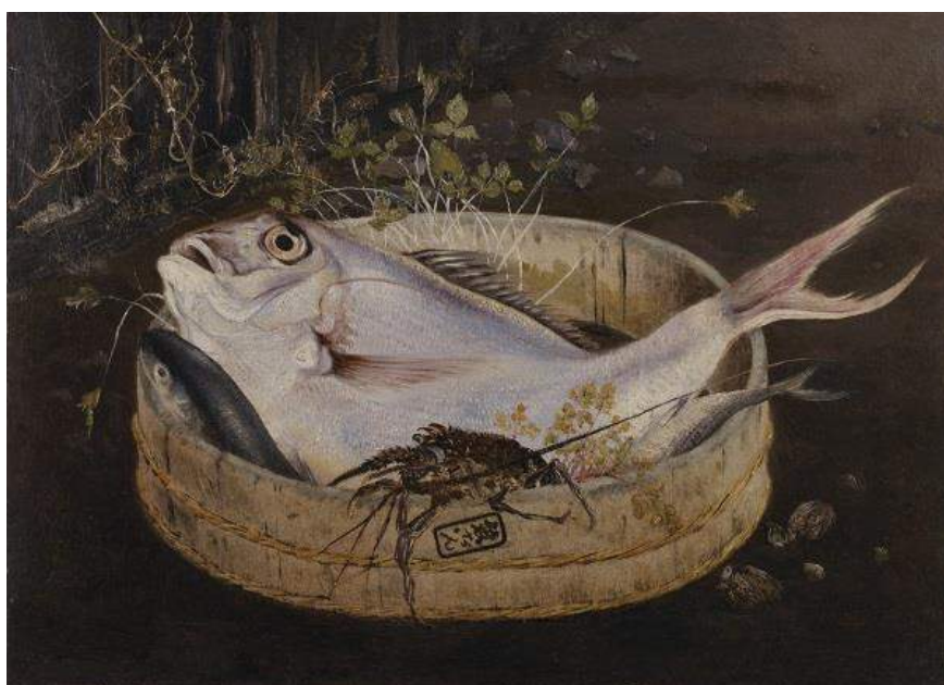
高橋由一《鯛図》油彩、板 笠間日動美術館所蔵