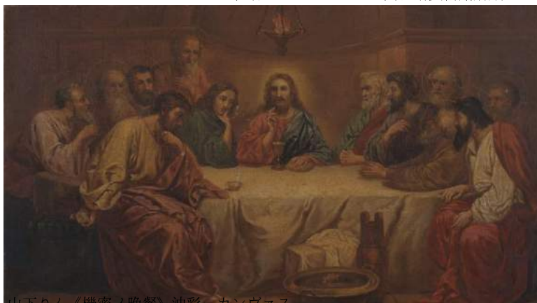
山下りん《機密ノ晚餐》油彩、カンヴァス