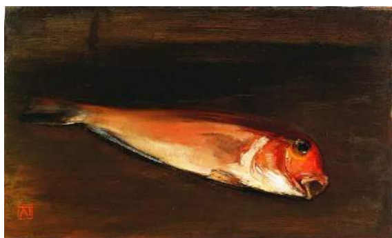
金山平三《あま鯛》油彩、板

第四章 うつわ (2) 魯山人の器：北大路魯山人《志野長方皿》、《色絵福字平向》、《赤呉須さけのみ》他