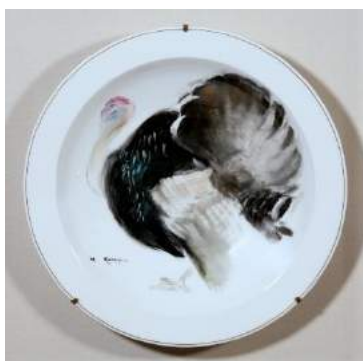
金山平三《七面鳥》陶器