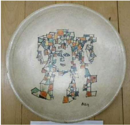
鴨居玲《絵付け皿（レ・トロア・グラス （三美神）》