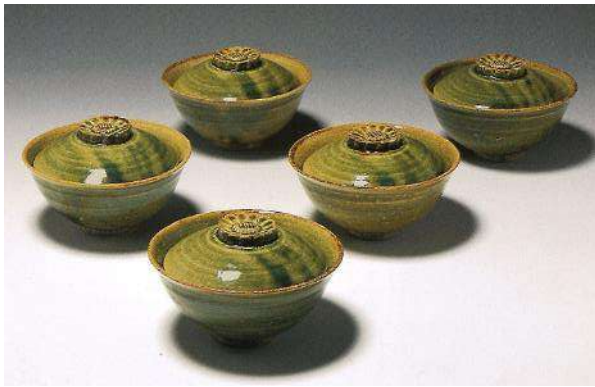
北大路魯山人《織部菊文蓋付茶碗》 カワシマ・コレクション