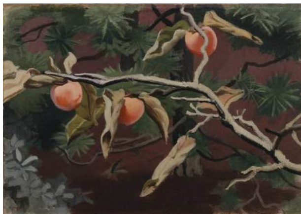
安井曾太郎《実る柿》油彩、カンヴァス