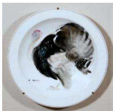
金山平三《七面鳥》陶器