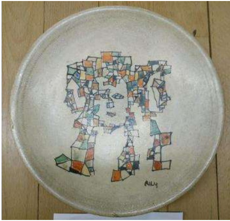
鴨居玲《絵付け皿（レ・トロア・グラス （三美神）》