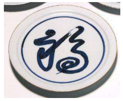
北大路魯山人《そめつけ福字平向》 カワシマ・コレクション