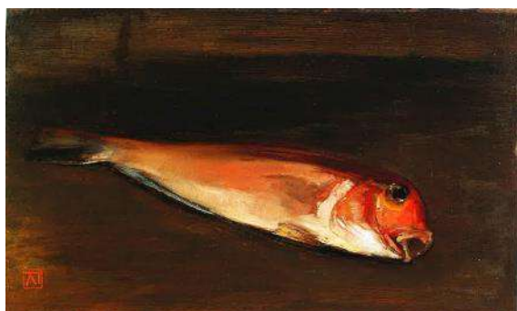
金山平三《あま鯛》油彩、板

第四章 うつわ (2) 魯山人の器：北大路魯山人《志野長方皿》、《色絵福字平向》、《赤呉須さけのみ》他