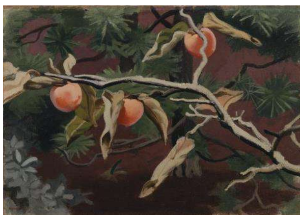
安井曾太郎《実る柿》油彩、カンヴァス