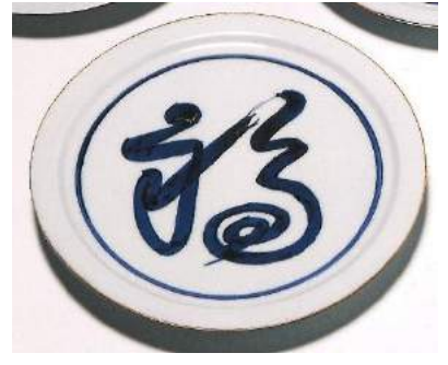
北大路魯山人《そめつけ福字平向》 カワシマ・コレクション 笠間日動美術館所蔵