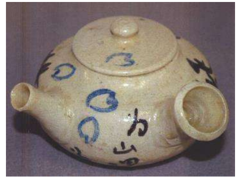
竹久夢二《蜂抱落花飛茶瓶》 山田市蔵コレクション