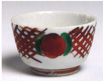
北大路魯山人《赤呉須さけのみ》