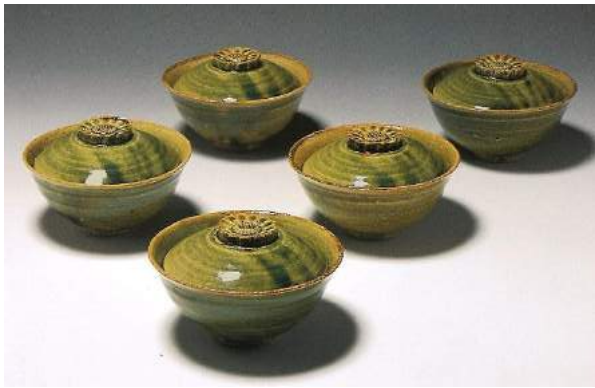
北大路魯山人《織部菊文蓋付茶碗》 カワシマ・コレクション 笠間日動美術館所蔵