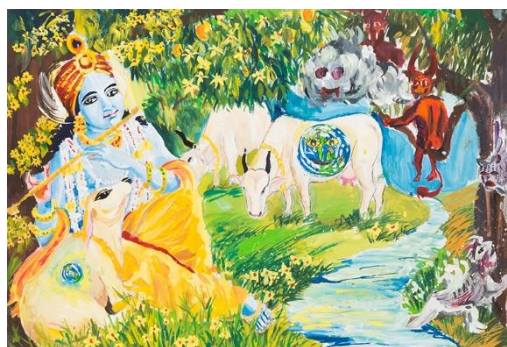
海外入選作品 インド 13歳 Ambre Dattaprasad Subhodh