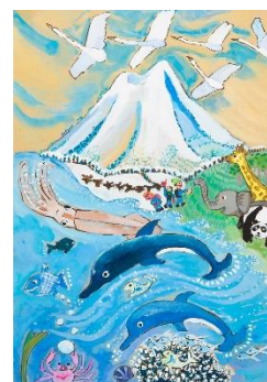
審査員特別賞 日本 11歳 松ヶ崎香蓮