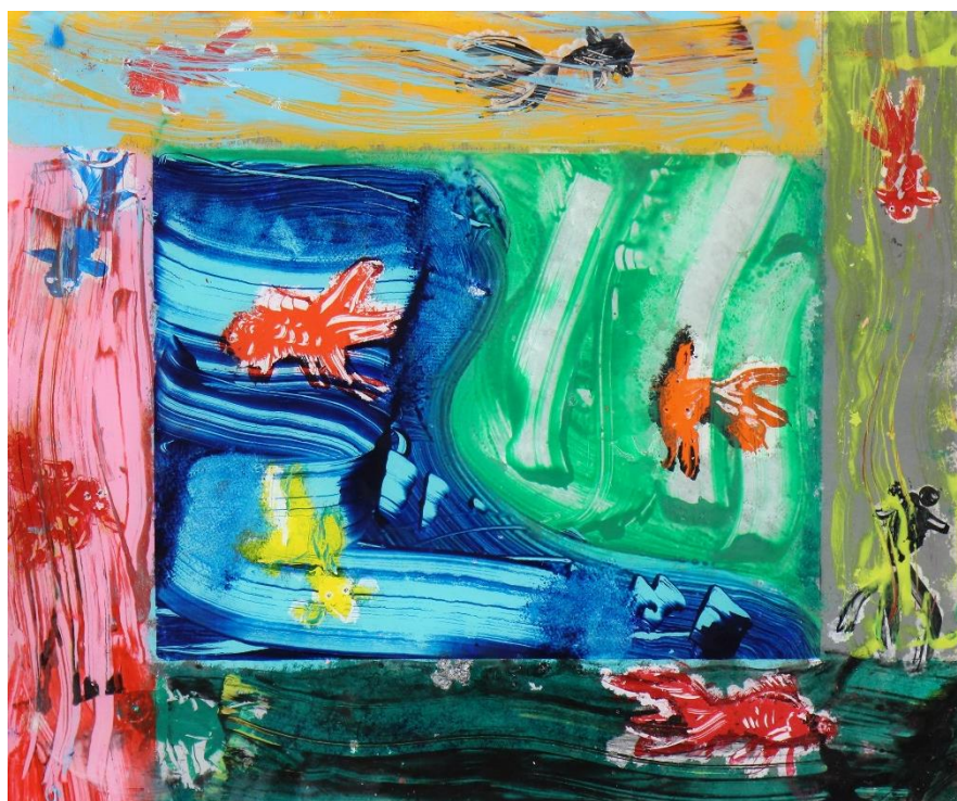
佐藤泰生「キンギョ」2018年ガラス絵