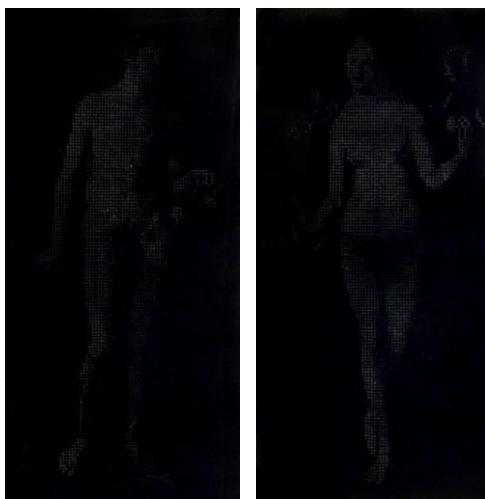
吉武弘樹《男・女（男）》 《男・女（女）》2017年