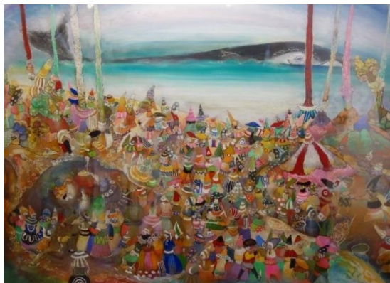
仁戸田 典子《静かな調和》2015年