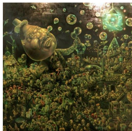
美馬匠吾《ハードボイルド探偵》2017年