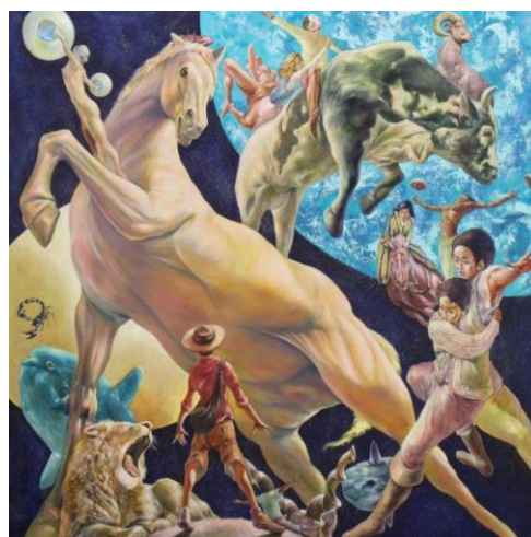
佐藤陽也《十二星座》2017年