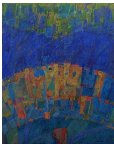
菊地達也《宙の振り子》2010-17年