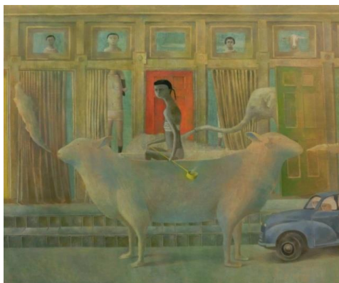
森 京子《悲しみは小さくちぎって》2016年