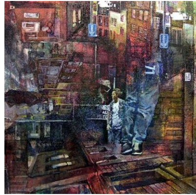
本間佳子《Is The Sky too High?》2011年