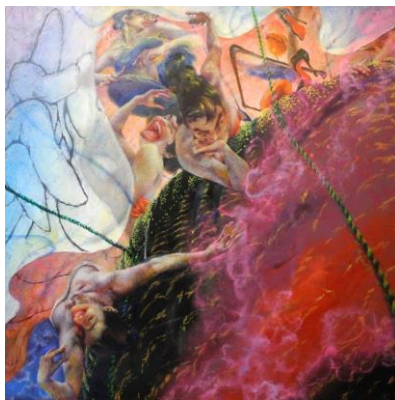
福島 万里子《女神が降りた日》2017年