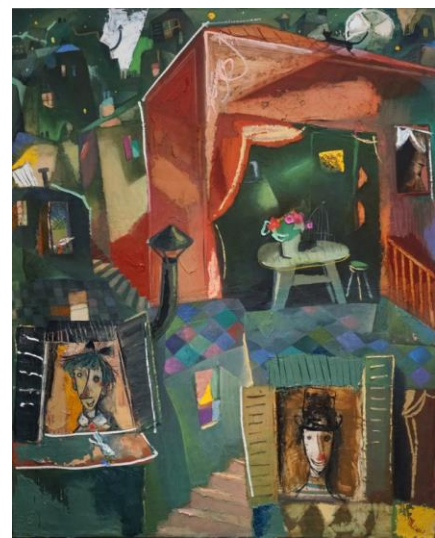
松井ヨシアキ《夢街の詩人と恋人》