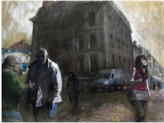
土井久幸《彼らの行方》2017年