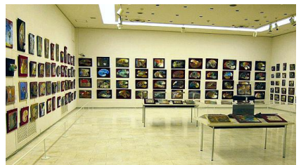
パレットコレクション