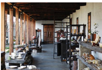
回廊ギャラリー 門

1 新宿(8:30発)＝上野(9:15発)＝<常磐道>＝★春風萬里荘(北大路魯山人の旧宅)＝モン・ラパン(フレンチのコースランチ)＝★笠間日動美術館(長谷川館長・副館長の特別対談会/天満敦子さんによるコンサート:17:30開演およそ90分の演奏会)＝上野(20:30予定) ※復路は上野着のみとなります。 一昼一