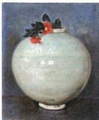
椿貞雄「壺(白磁大壺に椿)」 1947年 カンヴァス 油彩 72.7×60.6 米沢市上杉博物館蔵