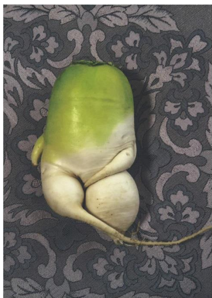
写真公募展 2022 【ユーモア】 日動画廊賞 安齋吉孝 様 「ちょっと恥ずかしい」