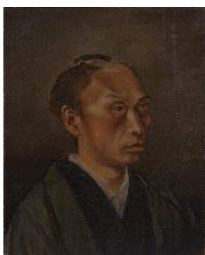
高橋由一《丁髷姿の自画像》 1866-67年

五姓田芳柳、高橋由一、百武兼行、川村清雄、五姓田義松、渡辺幽香、曾山幸彦、松岡 寿、二世五姓田芳柳、中村不折、岡 精一、佐久間文吾、湯浅一郎、渡部審也、北 蓮蔵、岡本桃乞、岩田榮吉、高塚省吾、伊牟田經正、野田弘志、森本草介、城戸義郎、桜田晴義、今井充俊、陶山 充、西房浩二、島村信之、諏訪 敦、安西 大、小木曾誠、伊藤尚尋、山本大貴、橋本大輔、他