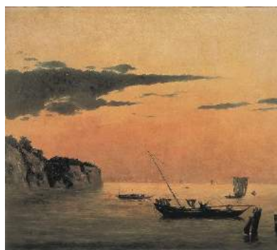
高橋由一《本牧海岸》