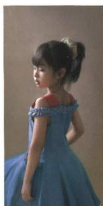
島村信之《葵》2010年 個人蔵