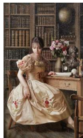
山本大貴《ノエマの森にて》 2019年 作家蔵（後期出品）