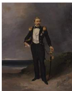
川村清雄《パレスレイケン像》