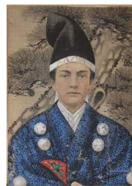
五姓田義松《唐人武士》