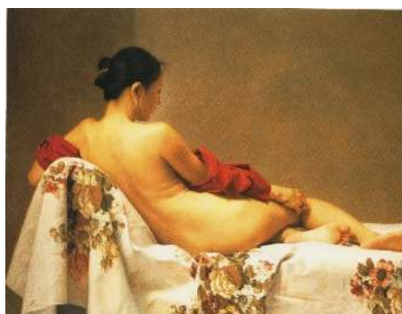
森本草介《微睡の時》1984年