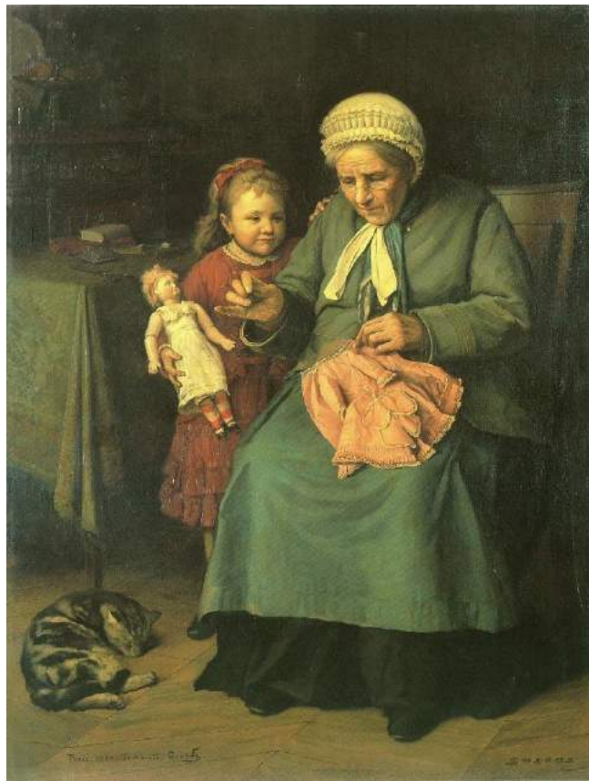
五姓田義松《人形の着物》1883年