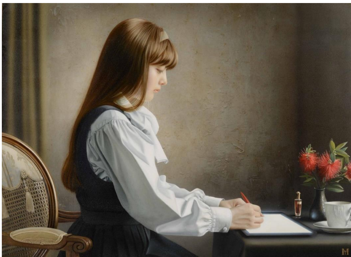
山本大貴《手紙を書く女》2012年 個人蔵

フェルメールの「手紙を書く女」は、 アイパッドで手紙を書く少女の姿となって現代日本に登場!