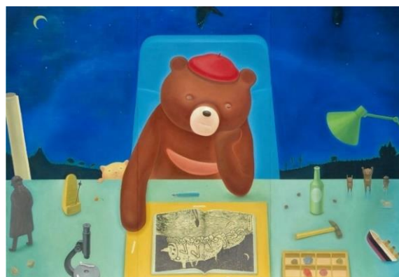
8 斎藤将《そういふものになりたい☆くま》2017年 くまさんも宮沢賢治がお気に入り！