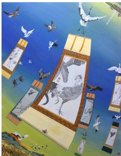
9. 松本亮平「渡り鳥」2019年 空を飛ぶ若冲の鶏！