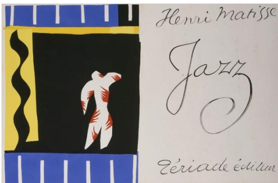
5. アンリ・マティス 《ジャズ》より「道化師」1947年 ジャズの精神と一致する切り紙絵