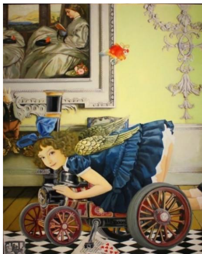
10. 渡邊榮一《旅の仲間》2017年 19世紀イギリスの画家 エッグの描いた女子たちと！