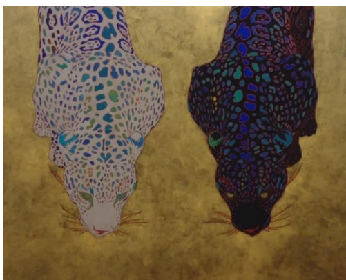
7 鶴飼義丈《豹》2012年 日本文化の様式美は受け継がれて