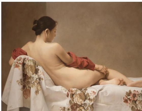
3. 森本草介《微睡の時》1984年