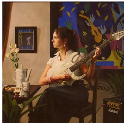
6. 山本大貴《Sound of Silence》2010年 マティスの「道化師」がかかる部屋