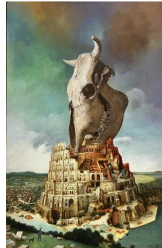
11 原 太一 《伝説》 2018年 ブリューゲル「バベルの塔」が…