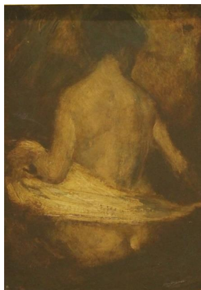
2. 鴨居玲《カリエール模写》1975年 晩年の名作《石の花》の原点!?