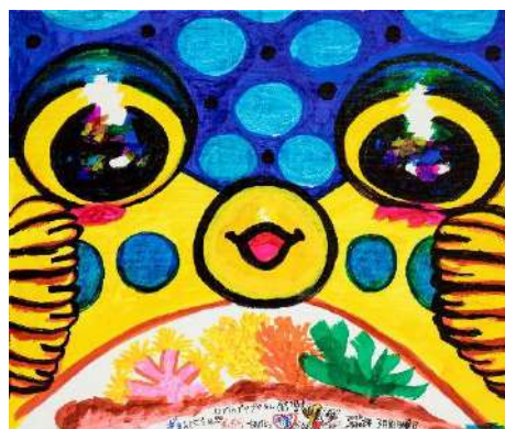
ハコフグのプクプクちゃん (♂) おす ギョーンには マッキー、ポスカ、油性マジック 37.9 × 45.5 cm