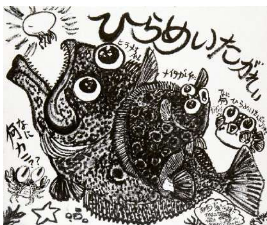
ひらめいたがれい 筆ペン、修正液 60.0 × 72.7 cm