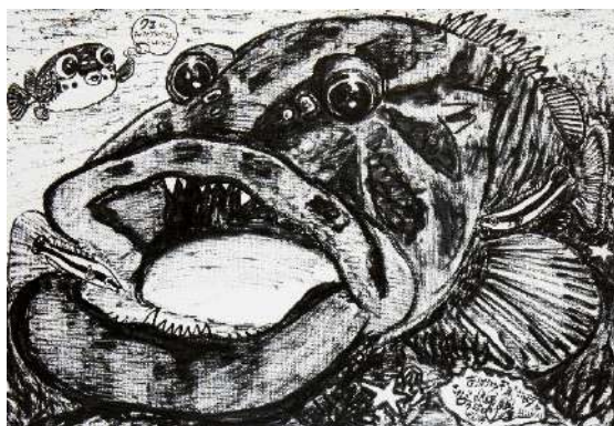
岩礁のハコフグちゃん クエちゃん とホンソメワケベラちゃん 筆ペン 50.0 × 72.7 cm