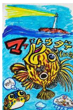
マア!! 灯台 マトウダイちゃん 筆ペン、コピック、油性ペン 72.7 × 50.0 cm