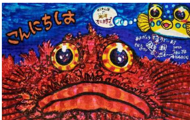
オニカサゴちゃん こんにちは！ 筆ペン、ポスカ、油性マジック 33.3 × 53.0 cm