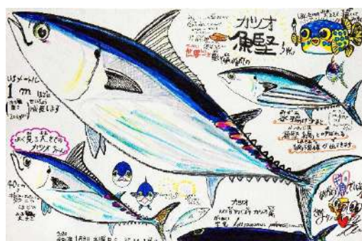
鯉ちゃん 筆ペン、クレヨン コピック、油性ボールペン 65.2 × 100.0 cm