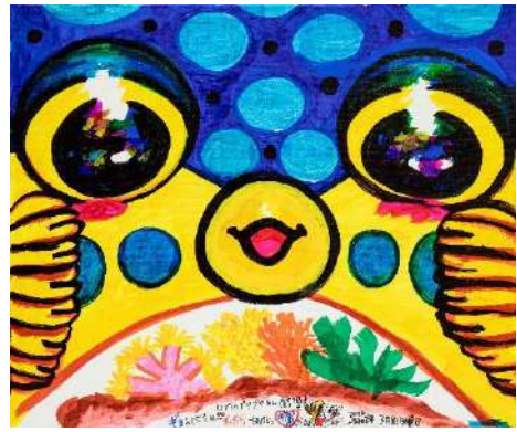
ハコフグのプクプクちゃん (♂) おす ギョーンには マッキー、ポスカ、油性マジック 37.9 × 45.5 cm