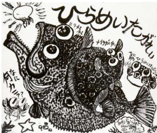
ひらめいたがれい 筆ペン、修正液 60.0 × 72.7 cm