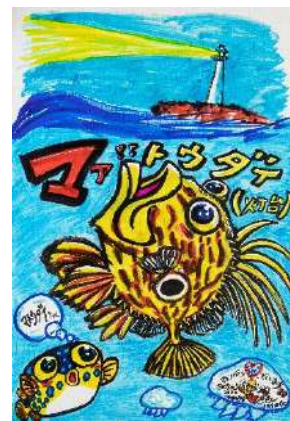
マア!! 灯台 マトウダイちゃん 筆ペン、コピック、油性ペン 72.7 × 50.0 cm