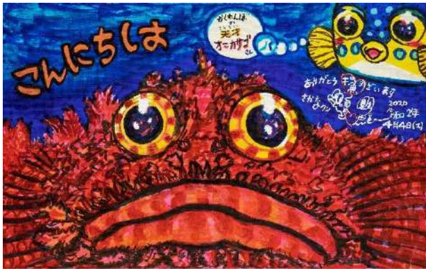
オニカサゴちゃん こんにちは！ 筆ペン、ポスカ、油性マジック 33.3 × 53.0 cm