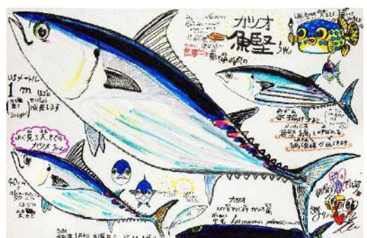
ブリちゃん 筆ペン、クレヨン コピック、油性ボールペン 65.2 × 100.0 cm